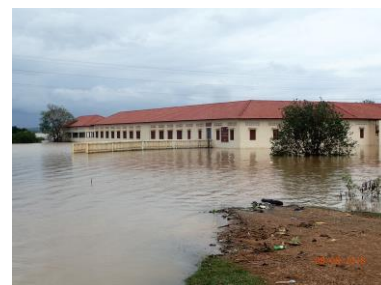
Une école inondée

Quand les rizières et les champs sont inondés sur une telle superficie, les vaches n'ont plus qu'un abri possible : les rares monticules et les routes... Celles en terre détrempées, sont vite défoncées, et celles qui sont en bitume servent aux éleveurs à déposer les aliments et à y entreposer le cheptel, rendant ainsi la circulation dangereuse de jour, et quasi impossible de nuit !