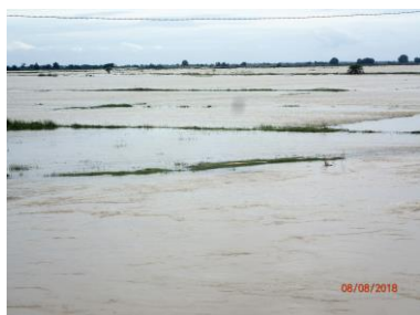
Inondation des rizières