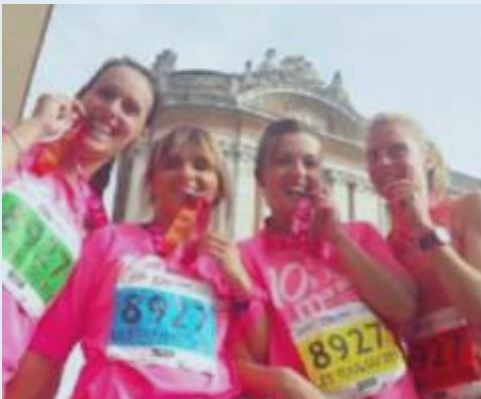
Marathon de Toulouse en relais (9 ème équipe féminine)