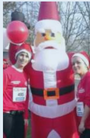
Corrida de Noel en faveur de l'association Dominique

Notre goût de l'aventure, notre esprit d'équipe, notre amour pour le sport et ses valeurs nous ont donné l'élan pour relever ce nouveau défi !